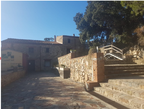
El Castell Vell Llinars de Vales