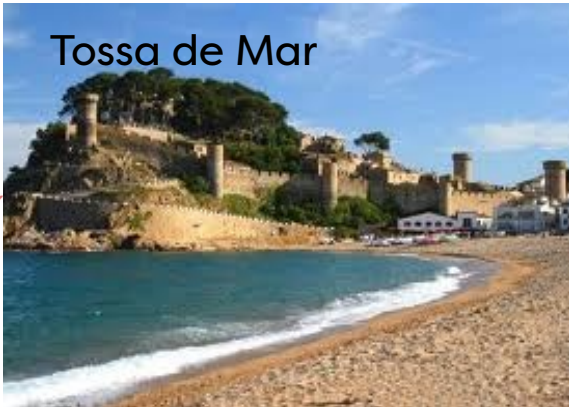
Tossa de Mar