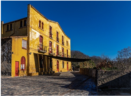
La Farga del Montseny